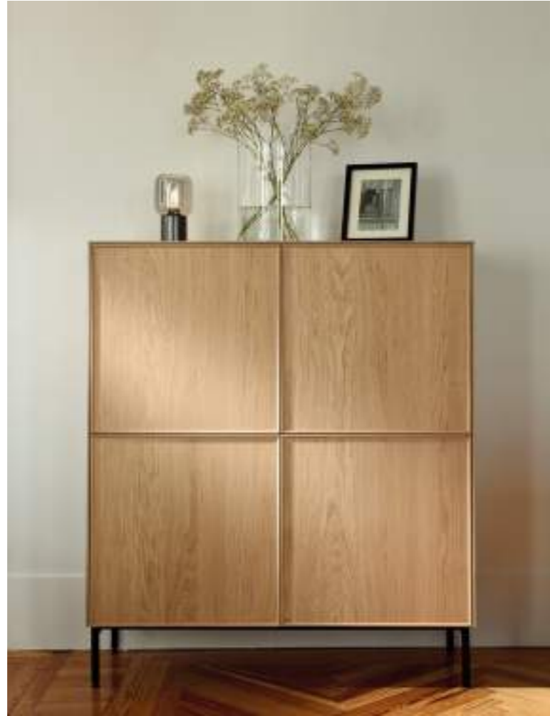
El mueble para servicio de mesa del comedor, articulado sobre una estructura metálica lacada en negro, se distingue por sus frentes de chapa de madera natural perfilados con madera maciza. O móvel de serviço de mesa, articulado sobre uma estrutura metálica lacada a preto, distingue-se pelas frentes em folha de madeira natural emolduradas com madeira maciça. The dining room table service unit, on a black lacquered metal structure, is distinguished by its natural wood veneer fronts, profiled with solid wood.