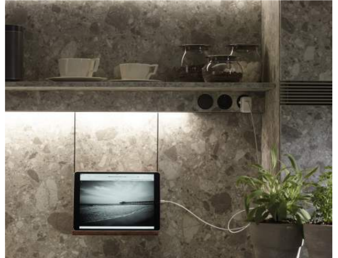
Accesorios para perfil de iluminación realizados en madera de nogal. Arriba: estante multiusos, portarrollo para papel de cocina, soporte con recipiente en porcelana y estante para recipientes portaespecias. Derecha: soporte para tablet o libro. Acessórios para perfil de iluminação fabricados em madeira de nogueira. Em cima: prateleira multiusos, porta rolos para papel de cozinha, suporte com recipiente em porcelana e prateleira para recipientes porta especiarias. Direita: suporte para tablet ou livro. Accessories for lighting profile made of walnut wood. Above: multi-purpose rack, roll holder, holder with porcelain jar and spice rack. Right: tablet or book stand.