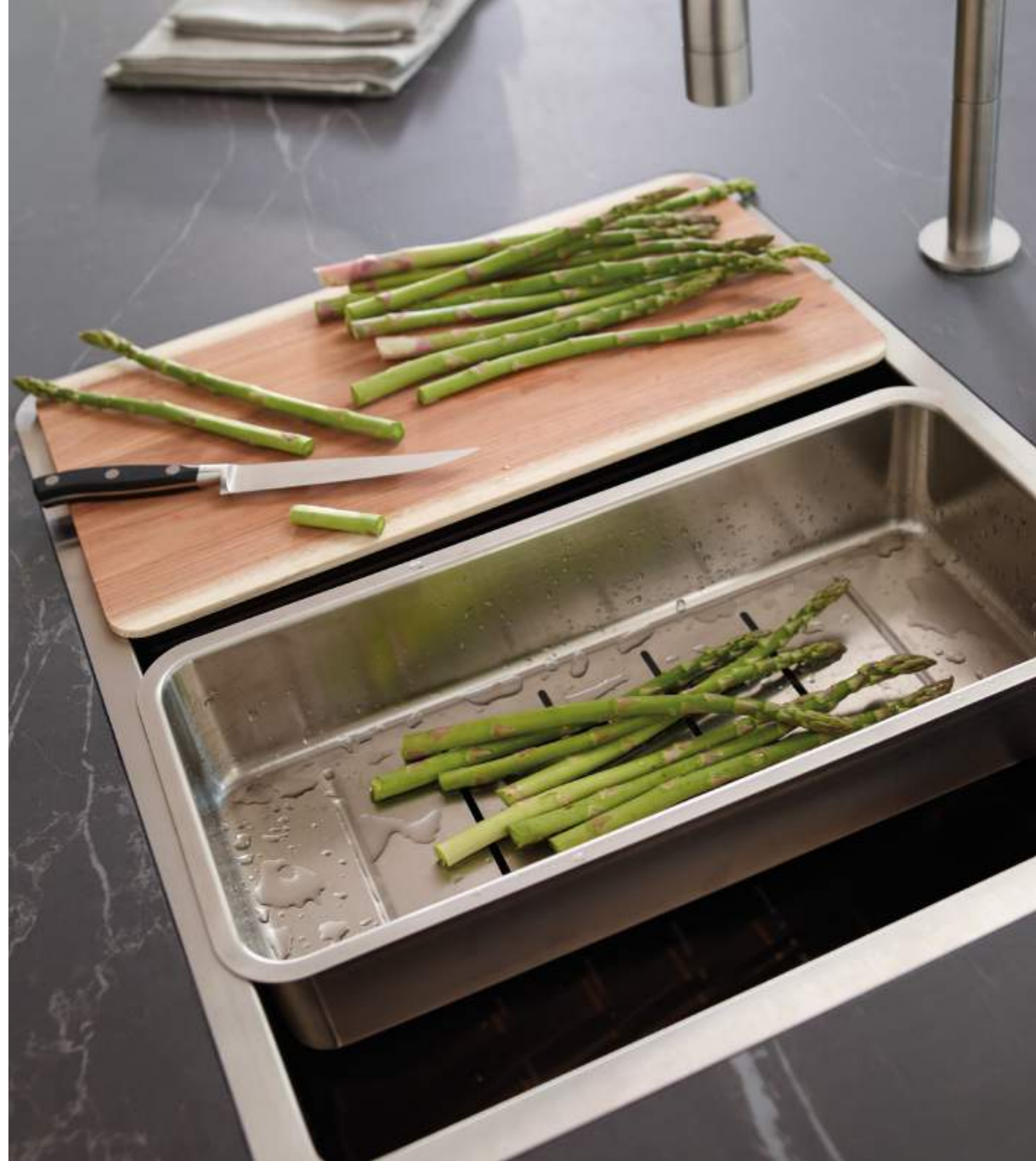
Derecha: plano de trabajo realizado en material porcelánico acabado Mármol Gris, con fregadero integrado. Direita: plano de trabalho realizado em material porcelánico acabamento Mármore Cinza, com lava-louças integrado. Right: worktop made in porcelain with Grey Marble finish, with an integrated sink.