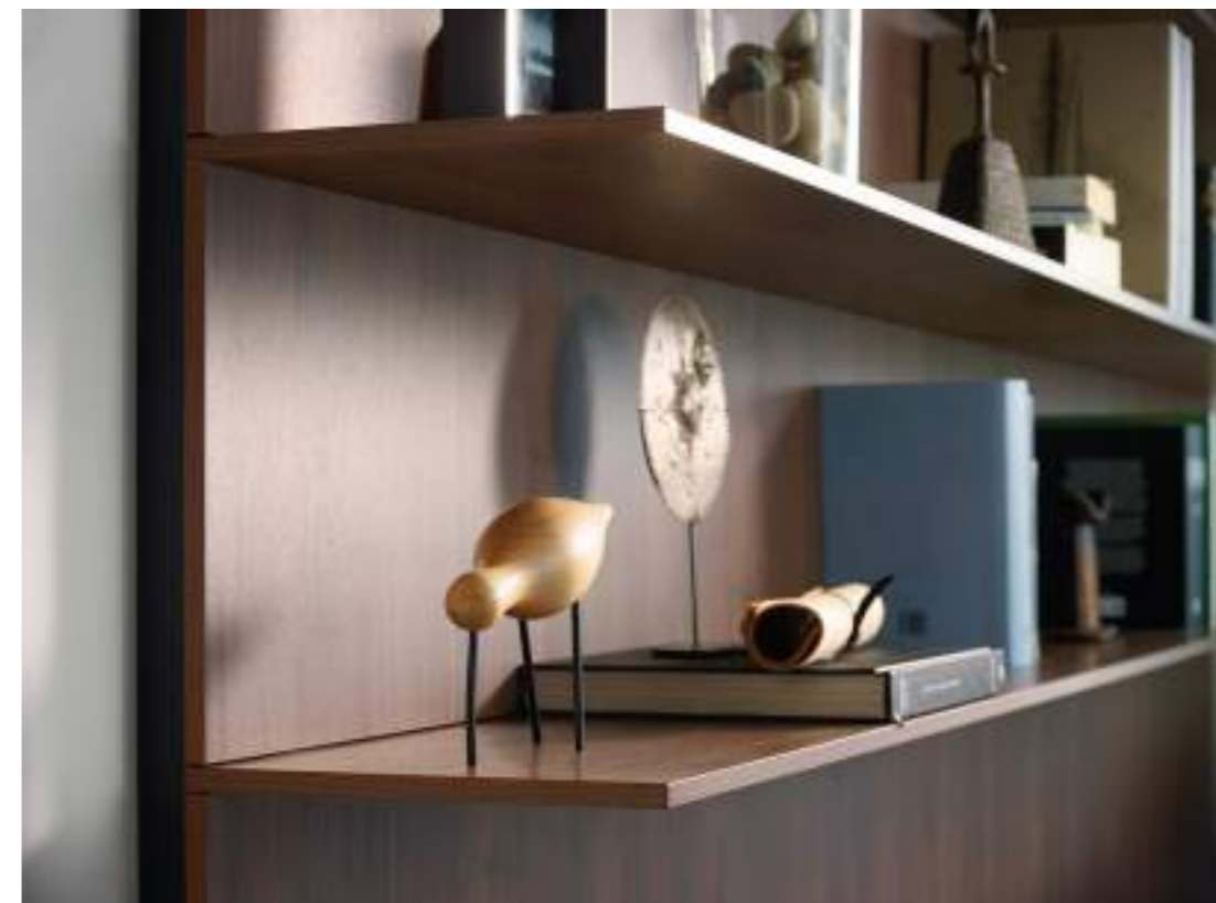
La escalera que da acceso al pasillo superior crea un espacio para la zona de lectura, acompañada de una pared panelada con baldas en la parte superior y cajones suspendidos en la inferior. A escada que dá acesso ao corredor superior cria um espaço para a zona de leitura, acompanhada de uma parede apainelada com prateleiras na parte superior e gavetas suspensas no inferior. The staircase leading to the upstairs hallway creates a space for the reading area, accompanied by a panelled wall with shelves above and wall-mounted drawers below.